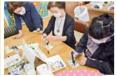
UVレジンシールづくり体験の様子

3周年記念セレモニーでは、今年も湍城幼稚園の子どもたちに元気いっぱいのダンスを披露していただきました！ セレモニー後は、イベントとして「UVレジンシールづくり」や「健康教室」を行い、みんなで交流を楽しみました！