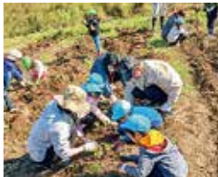
農保育園での芋掘りの様子