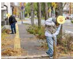
落ち葉掃きの様子