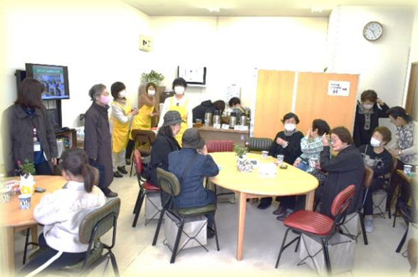
まちなかボランティア

少しずつボランティア活動したいと希望する団体や個人・学生が増えてきました。 ボランティアには、介護施設に訪問し、高齢者と交流する活動や能代市のクリーンアップなどいろいろな活動があります。 現在、能代市ボランティアセンターでは、ボランティアを受け入れてくれる企業や施設、団体を募集しています。ボランティア活動の受け入れが可能でしたら、ぜひご連絡下さい。