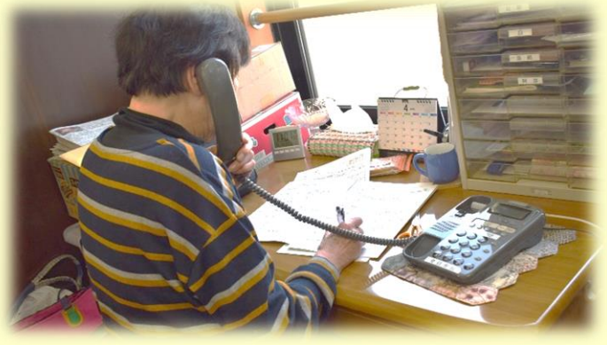
ふれあい安心電話 声のボランティア