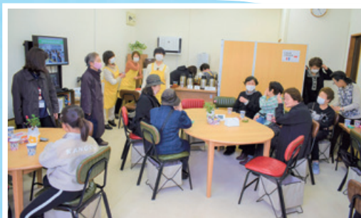
オープン初日の様子