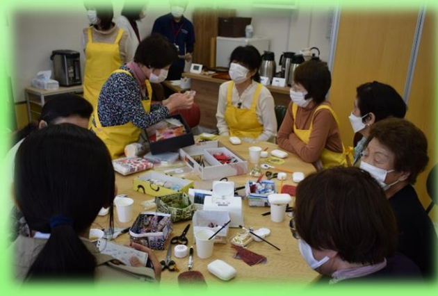
【ボランティアをしている様子】